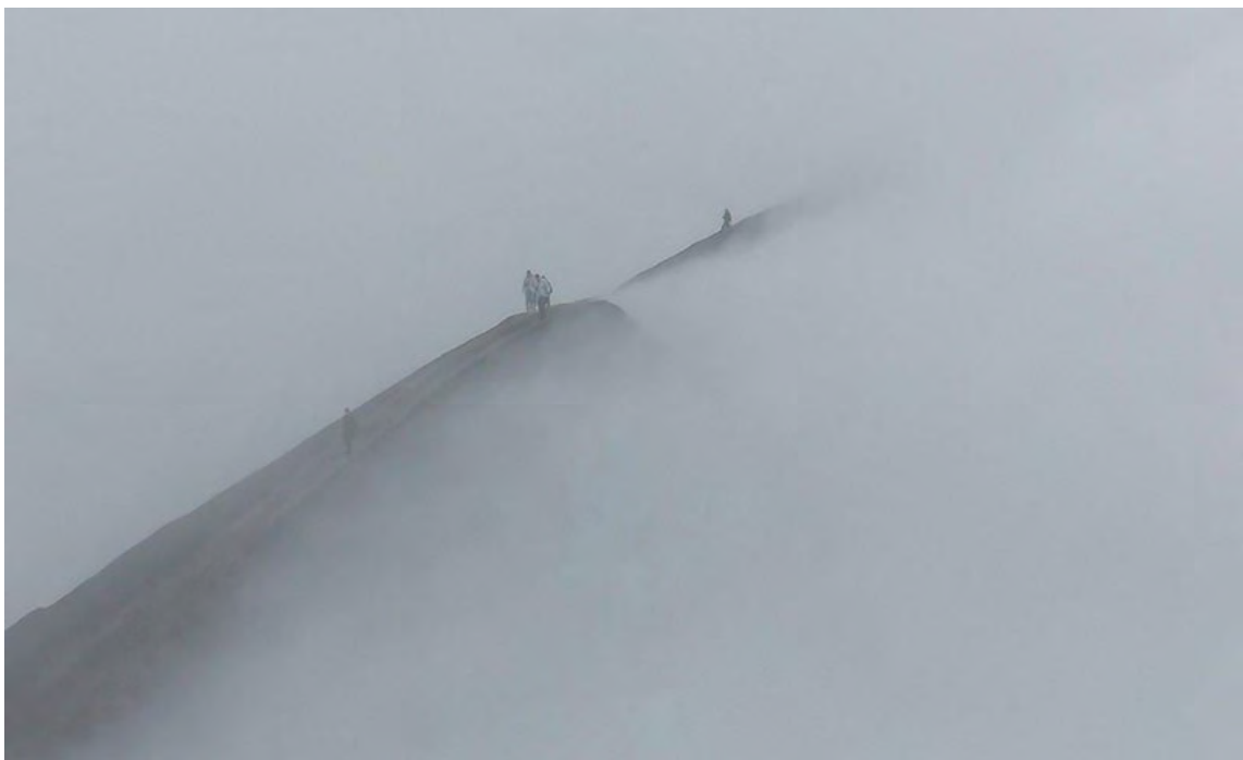
Nach Tempeln und Kultur geht es bei unserem nächsten Ausflug wieder mehr um die schöne Natur Indonesiens. Doch leider spielt uns das Wetter nicht gerade in die Karten und wir können den Sonnenaufgang am Mount Bromo durch die Nebel- und Regenwolken nicht erkennen. Nichtsdestotrotz wandern wir mit einem Teil der Gruppe entlang des Kraters und fühlen uns in eine mystische Geschichte versetzt.