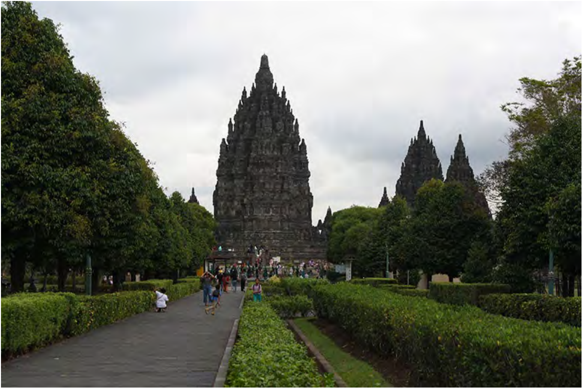
Neben dem größten buddhistischen Tempel weltweit steht auch der größte hinduistische Tempel Indonesiens bei Yogyakarta – Prambanan.