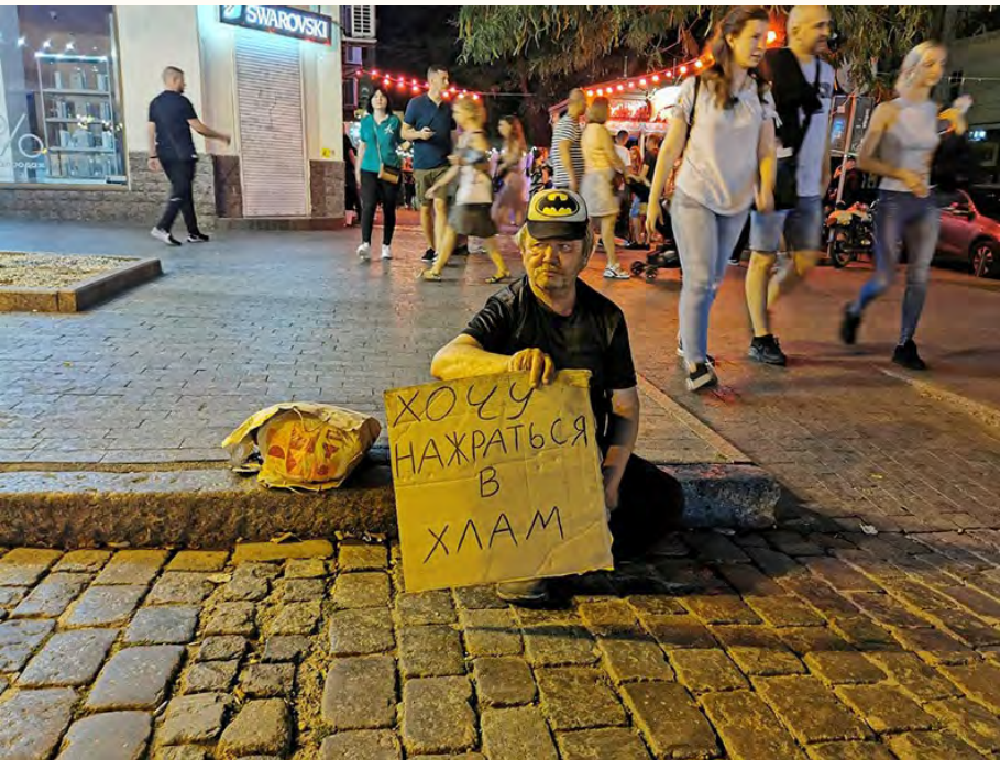
Wir sind angekommen in Odessa, der „Perle am Schwarzen Meer“, einer multikulturellen Stadt, in der das Leben vor allem am Abend pulsiert.