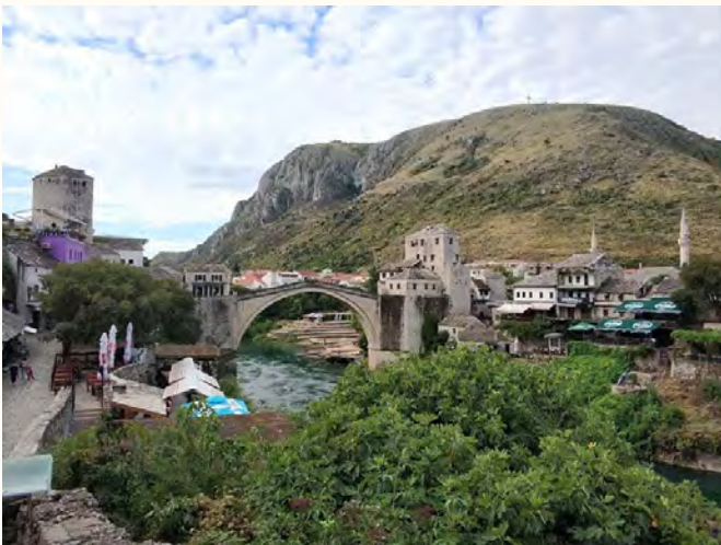
Die berühmte Brücke von Mostar.

Danach auf kurvigen, gut ausgebauten Straßen weiter nach Mostar. Diese haben viel mehr Gefälle als man denkt und die Bremsen werden wirklich gefordert. Begeistert und voller Eindrücke treffen wir auf dem Stellplatz ein.